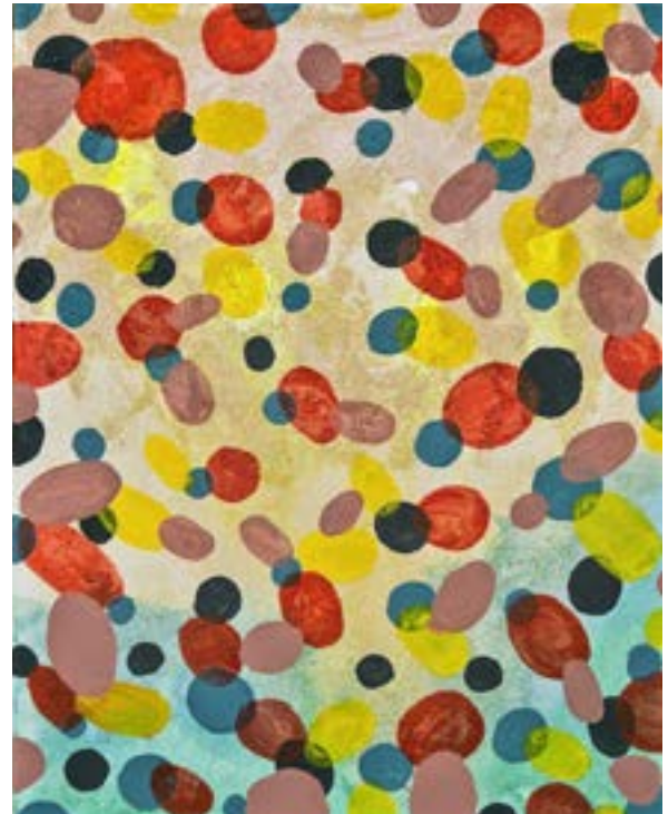
Química Técnica mixta sobre lienzo 50 x 40 cm