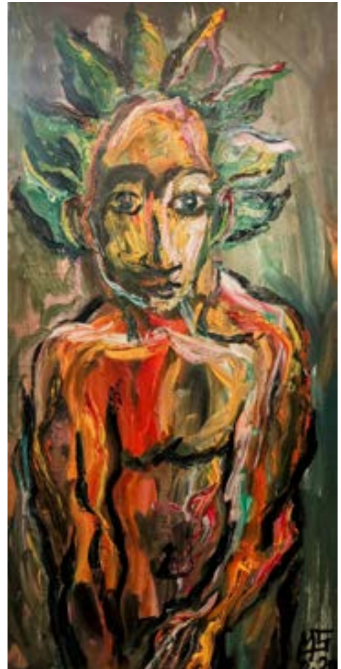
Baco Óleo sobre tabla 120 x 60 cm