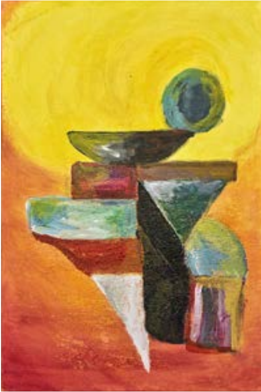
Equilibrio Técnica mixta sobre lienzo 60 x 40 cm