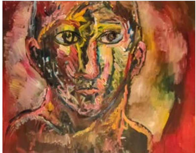
Orestes Óleo sobre lienzo 62 x 72 cm

Mis imágenes están desprovistas de toda artificialidad, son tal cual, de ahí esa extraña mezcla entre clasicismo, naif, expresionismo y crisis existencial, pueden resultar atormentadas para algunos espectadores y tiernas para otros, no deja de ser una pintura sabrosa...”.