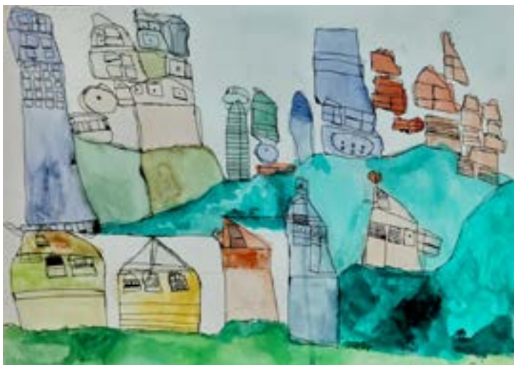
San Francisco Técnica mixta sobre papel 40 x 60 cm