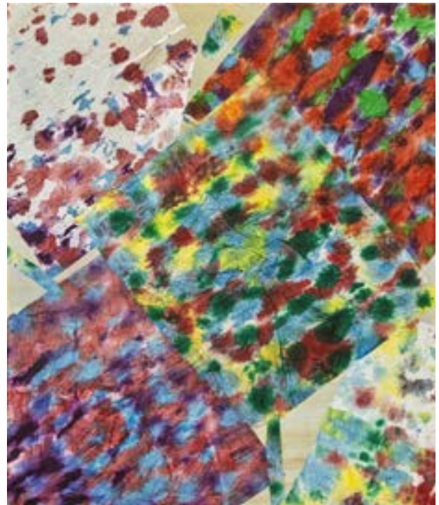
Sinestesia Técnica mixta sobre lienzo 60 x 50 cm