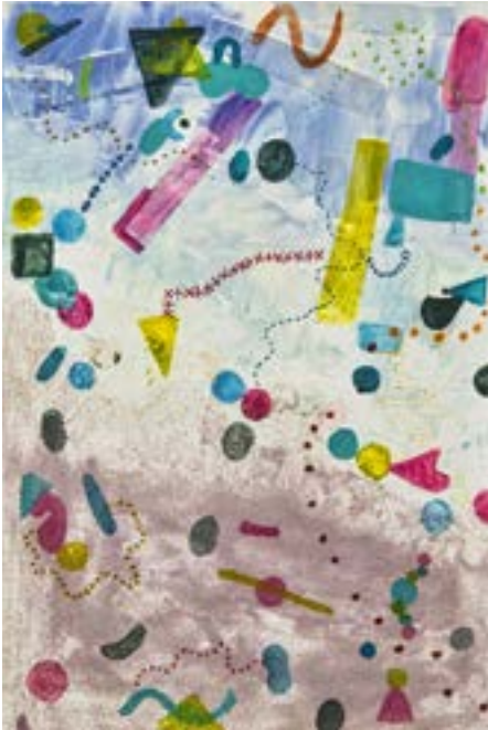
Partículas Técnica mixta sobre lienzo 40 x 60 cm