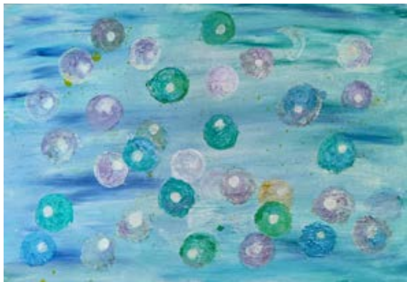
Burbujas Técnica mixta sobre lienzo 40 x 60 cm

Ahora que tengo 10 años he conseguido hacer unos cuadros preciosos”.