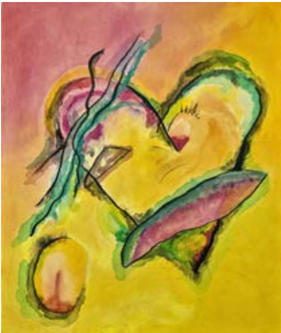
Poema a Kandinsky Técnica mixta sobre lienzo 50 x 60 cm