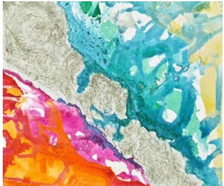
Archipiélago Técnica mixta sobre lienzo 50 x 60 cm