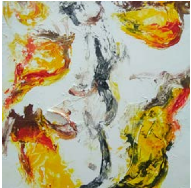
Fuego Técnica mixta sobre lienzo 50 x 50 cm

La creatividad, la paciencia y el esmero que pone en cada detalle son algunas de sus principales cualidades.