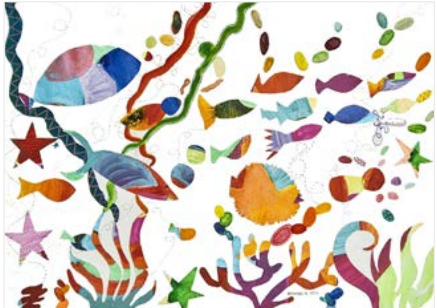
Acuario Técnica mixta sobre papel 70 x 50 cm

Es una magnífica ejecutora, minuciosa y natural, con un alto sentido de la estética y un elevado manejo del color.