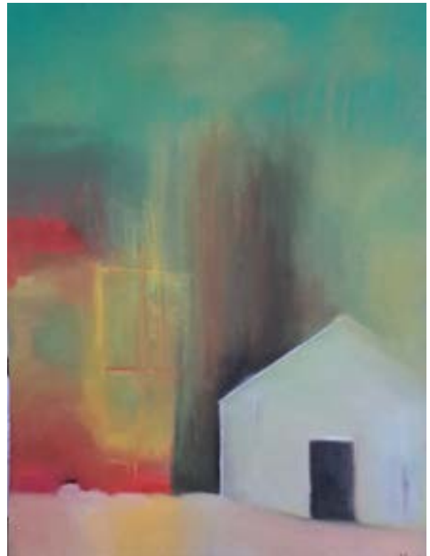
Casa verde Pastel blando sobre papel 62 x 48 cm