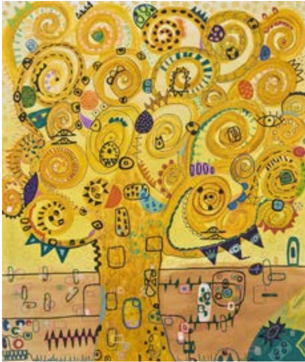
Homenaje a Klimt Técnica mixta sobre lienzo 60 x 50 cm