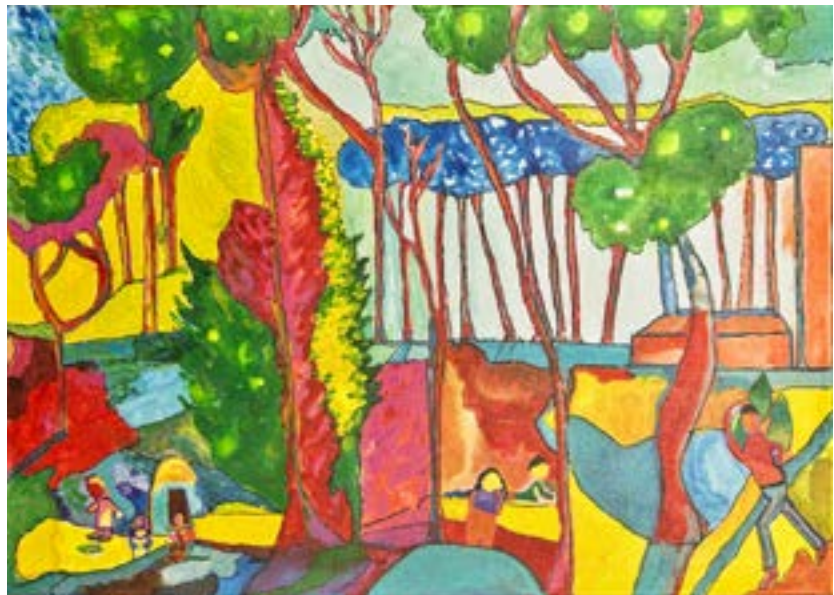
Interpretación de André Derain Técnica mixta sobre lienzo 70 x 50 cm

Hoy doy gracias porque esta dedicación me ha hecho crecer y sentirme más feliz”.