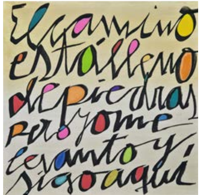
Aquí sigo con Gambino Técnica mixta sobre lienzo 50 x 50 cm