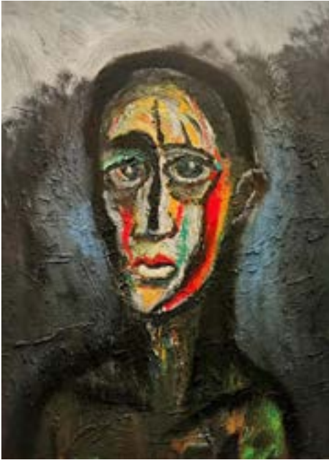
Accattone Óleo sobre tabla 80 x 60 cm