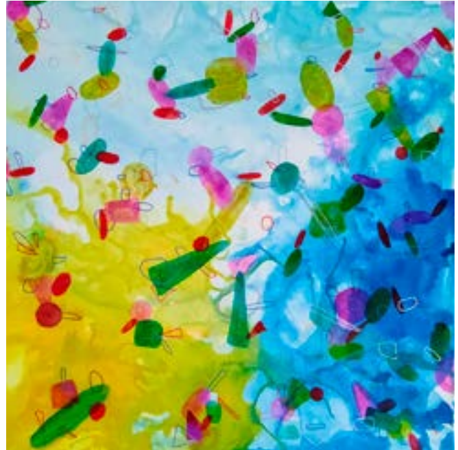
Sinfonía Técnica mixta sobre lienzo 60 x 60 cm