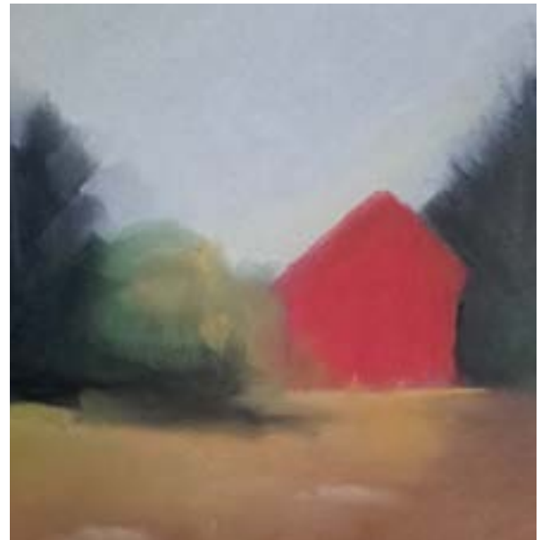
Casa roja Pastel blando sobre papel 33 x 31 cm

Tras un breve coqueteo con el paisaje, me he centrado en composiciones abstractas y llenas de color”.