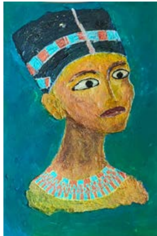
Nefertitti Técnica mixta sobre cartón 60 x 40 cm

que no se den, mejor así, pasad de largo no existan, mejor dicho, que no se acerquen que este arte pueda surgir desde la suciedad cuanto más sucias las manos, antes creído”