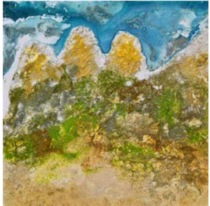
Cumbres doradas Técnica mixta sobre lienzo 60 x 60 cm