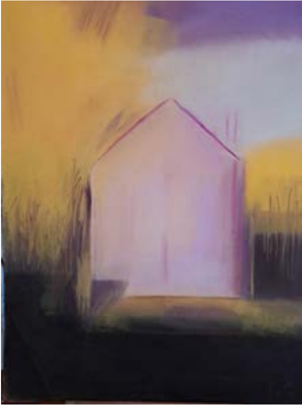
Casa lavanda Pastel blando sobre papel 62 x 48 cm