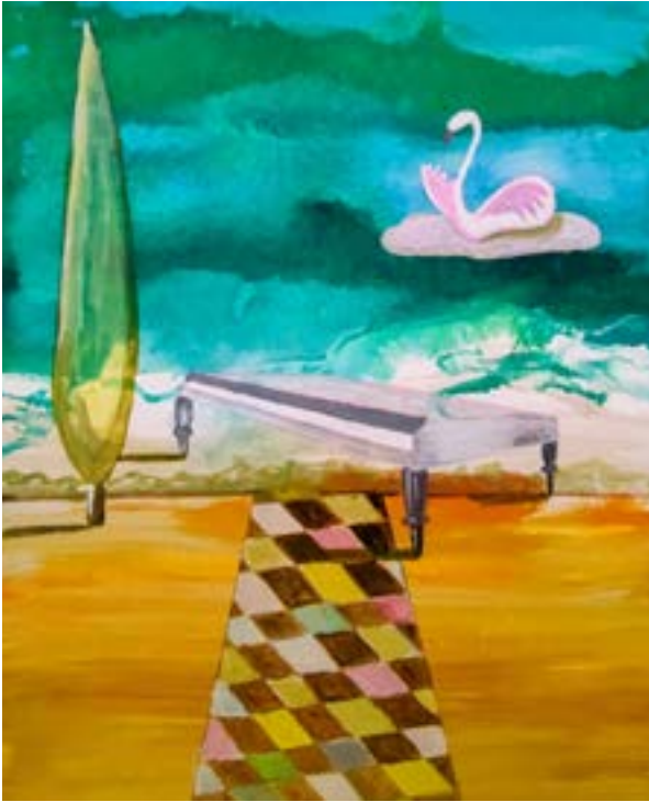
Cisne, piano y ciprés Técnica mixta sobre lienzo 50 x 40 cm