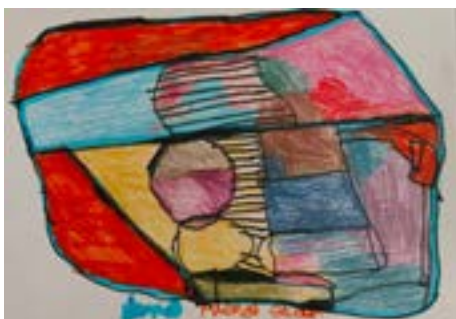
Atenas Técnica mixta sobre papel 21 x 30 cm